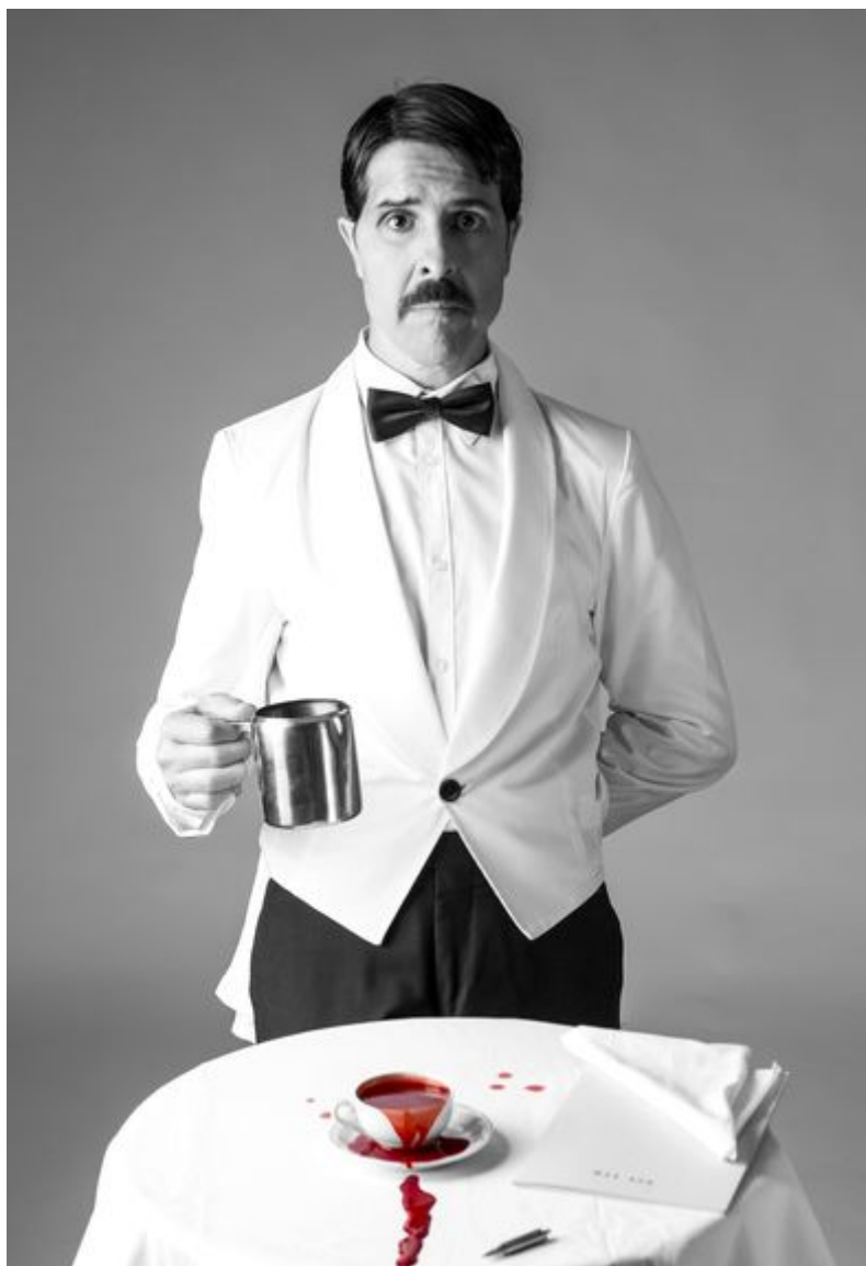
Imagen de 'La verdadera muerte de FF'